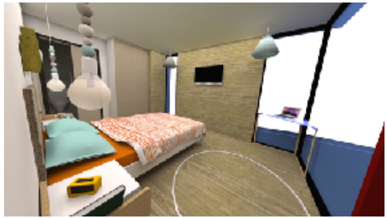
Décoration Carnets Libellule

Concrètement, les fonctionnalités mises en œuvre par l'Universal Design rendent généralement la plupart des tâches et des activités plus faciles et plus agréables pour tous, clients et collaborateurs. N'oublions pas que 80% des handicaps ne se voient pas !