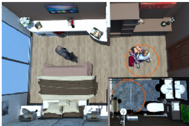
Chambre de 26 m 2 - Décoration Carnets Libellule